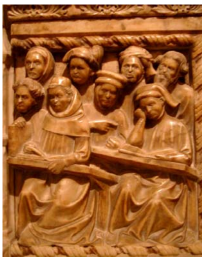
Abbildung 1: Bologneser Studenten

Bologna errang einen überragenden Ruf für die juristische Ausbildung vor allem dadurch, dass die Überlieferung juristischen Wissens und juristischer Texte aus dem alten Rom teilweise auf dem Weg Konstantinopel-Ravenna erfolgte. So wurde in Bologna der Zivilrechtskodex ( codex juris civilis ) des oströmischen Kaisers Justinian nicht nur vervielfältigt, sondern auch kommentiert und für den Gebrauch in der Rechtspraxis überarbeitet. Als Basis des Kirchenrechts wurden Erlasse der Päpste gesammelt und aufbereitet. Kennzeichnend für die damalige Rechtspraxis war, dass man nur dann als Rechtsanwalt oder Notar zugelassen wurde, wenn man die entsprechenden Texte besaß.