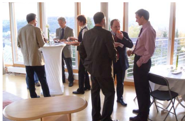
Abbildung 2: Interessante Gespräche beim Tag der offenen Tür.

Die zahlreichen erfreulichen Rückmeldungen, auch seitens Lothar Späth