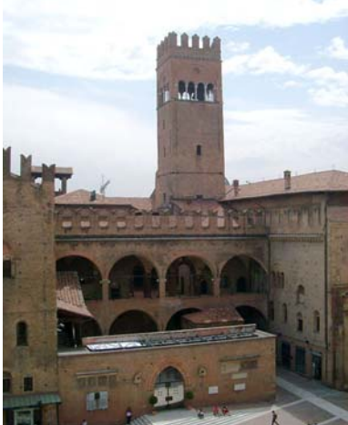
Abbildung 2: Palast des Königs Enzo

Übrigens: Für Schwaben besitzt die Stadt Bologna noch einen besonderen historischen Reiz. Hier liegt Enzo, ein Sohn Friedrich II. begraben. Enzo – außerhalb Bolognas auch Enzo genannt, auf deutsch Heinrich oder Heinz – war eines von vier unehelichen Kindern des großen Stauferkaisers. Seine Mutter soll eine süddeutsche Adelige gewesen sein, was Historiker unter anderem daraus schließen, dass Enzo seine Jugend im schwäbisch-elsässischen Raum verbrachte. Der Kaiser nahm ihn mit 19 Jahren in sein Gefolge auf, und zwar durch die Schwertleite (Ritterschlag). Im politischen Wettstreit zwischen Kaiser und Papst um die Insel Sardinien heiratete Enzo die Witwe eines Fürsten, zu dessen Lehensgebiet der nördliche Teil Sardinien gehörte. Enzo verbrachte allerdings nur ein Jahr auf Sardinien, da der Kaiser ihn alsbald mit der Aufgabe eines Legaten (Kaiserboten) für das italienische Festland betraute.